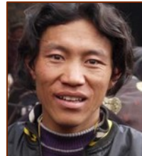
Responsable du Poste de soins