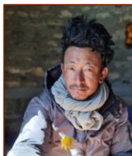
Directeur de CMS