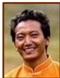
Gyalpo Coordinateur du projet