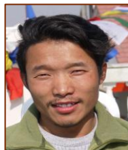
Directeur de CMS