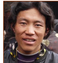
Responsable du Poste de soins